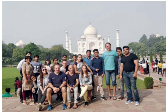
Študenti ivanskej SOŠ opäť v Indii