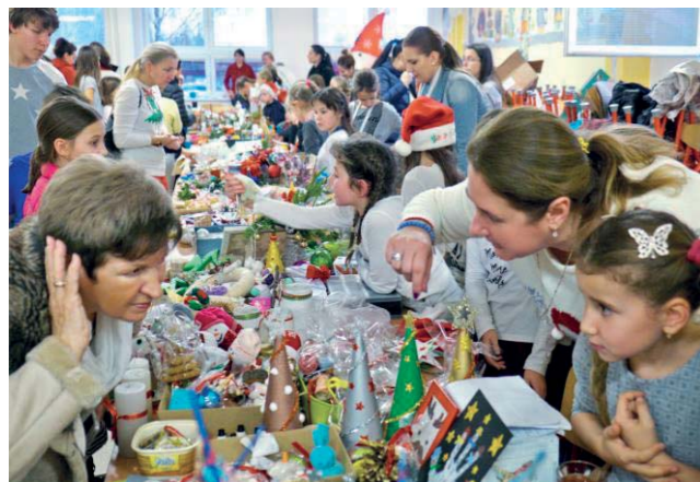
Vianočné trhy na základnej škole a na Námestí sv. Rozálie