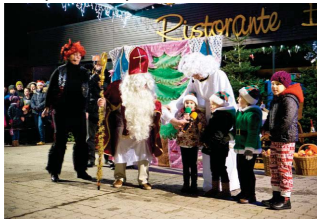
Mikuláš v Dennom penzióne a na Námestí sv. Rozálie