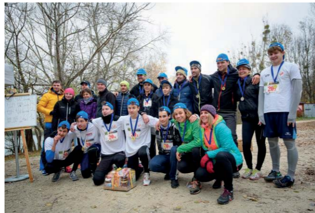
Šturovský bežecký maratón