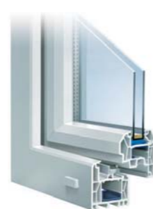
TROCAL Innonova Elegance