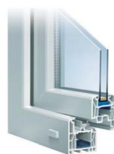
TROCAL Innonova Classic