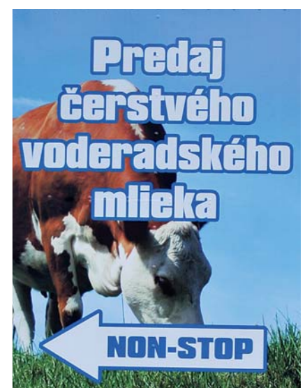
Prípravujeme skúšobnú prevádzku