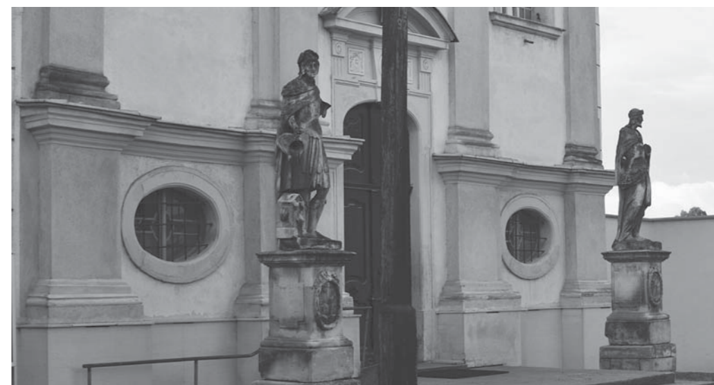
Sochy od 30.9.2010 v reštaurátorských dielňach /Grant/