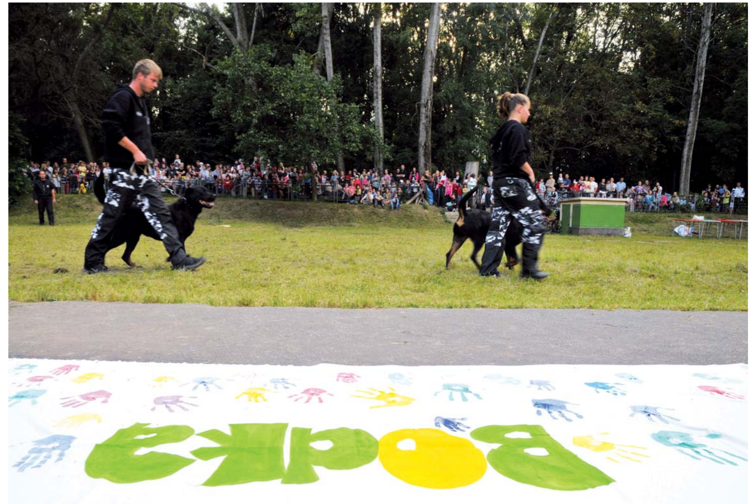
Populárne podujatie Bodka za prázdninami sa konala 12.9.2010

| Referendum v čísloch | Aktuálne zo stavieb v obci | Burza detského oblečenia | | Jesenný zber veľkoobjemového odpadu | Prerokovanie dopravnej štúdie |